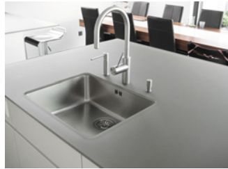
Glaserarbeiten, gefertigt nach individuellen Wünschen

Das thermisch vorgespannte Einscheiben-Sicherheitsglas SECURMART ESG des österreichischen Herstellers Glas Marte eignet sich gut für Küche und Bad durch seine hohe Temperaturwechselbeständigkeit und seine mechanische Festigkeit. Die firmeneigene Fertigung des Materials bei Glas Marte ermöglicht Verglasungen, die nach individuellem Kundenwunsch exakt auf Maß gefertigt sind. Von Bohrungen und Aussparungen über diverse Verfahren der Kantenbearbeitung bis zum Schleifen und Polieren ist alles möglich, ebenso wie das dekorative Sandstrahlen oder Siebdruckemaillieren. Glas empfiehlt sich in der Küche