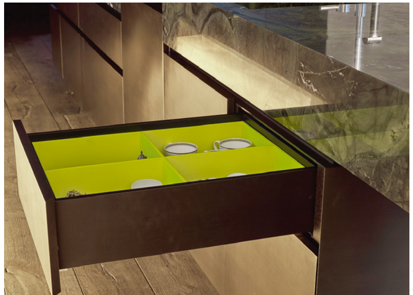
Das Farbenspiel als Zuordnungssystem zwischen Tombak, Stein und Esche