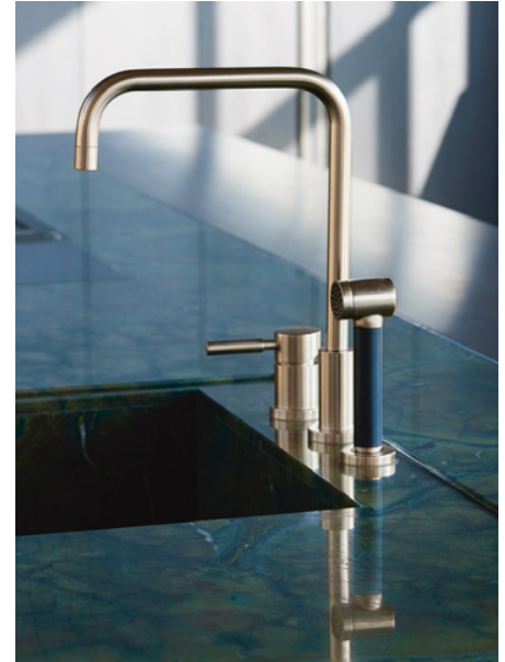
Edelstahllarmatur, abgesetzt platziert im individuell ausgearbeiteten Natursteinblock