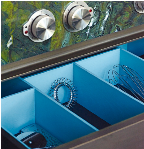
Die Schubkasteninlays sind prägnant farbig lackiert