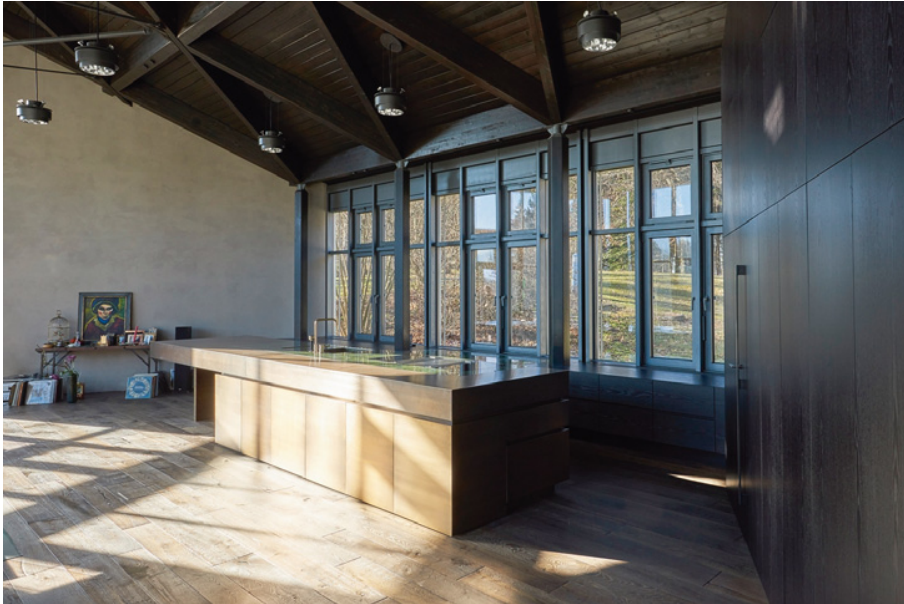
Der Küchenblock als zentrales Element der Mehrgenerationenküche. Maßgeschneidert sind im unteren Teil der 9m-Fensterfront Schubkästen und Auszüge eingearbeitet