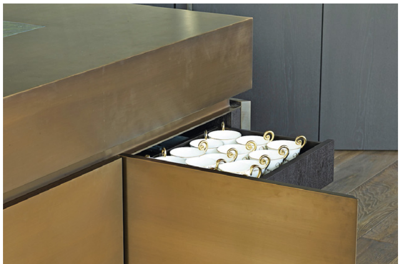
Gefaltetes 2-mm-Metall, brüniertes Tombak, auf Arbeitstisch und Fronten