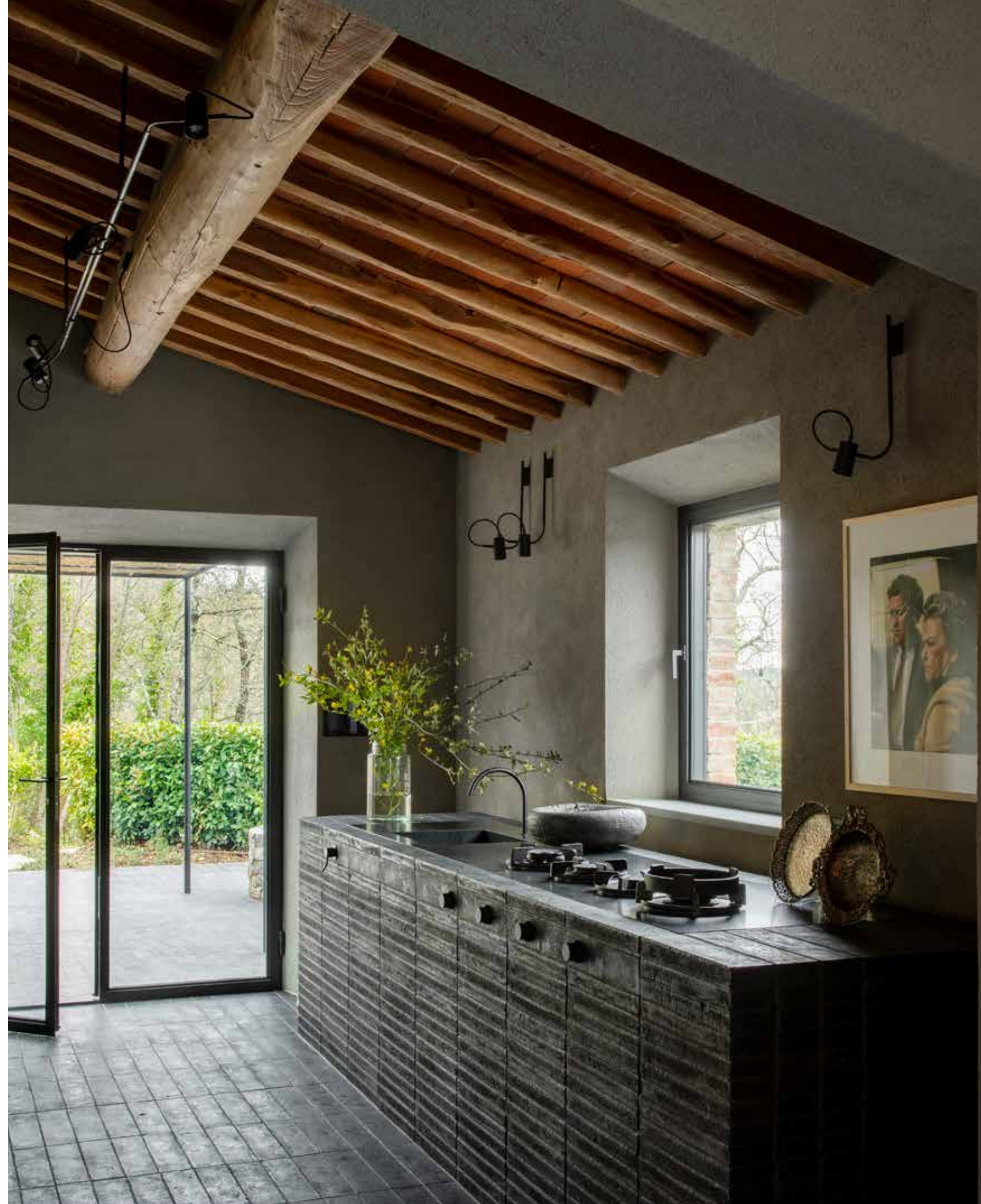
Met de klok mee vanaf rechtsboven De serene masterbedroom met foto's van Simone Schiesari, outdoormeubels door Klaus Lichtenegger, de gastenslaapkamer, op de salontafel keramiek en kunst van galerie Dei Bardi Arte in Arezzo Rechterpagna Keuken en vloer in tegels van Fornaci Manetti Gusmano & Figli, aanrecht en wasbak van natuursteen Nero Assoluto, branders van Pitt Cooking, wandlampen van Office Heinzelmänn Ayadi